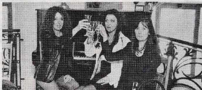
Le titolari del Gran Café (Zen)